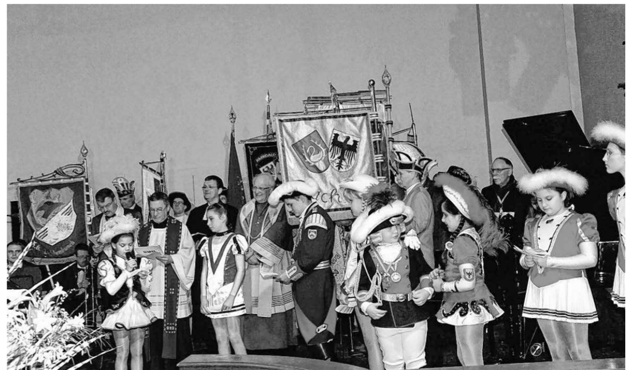
Die Citykirche war rappellvoll am Mittwochabend beim ökumenischen Sessions-Eröffnungsgottesdienst. Kleine Närrinnen und Narren hielten die Fürbitten.